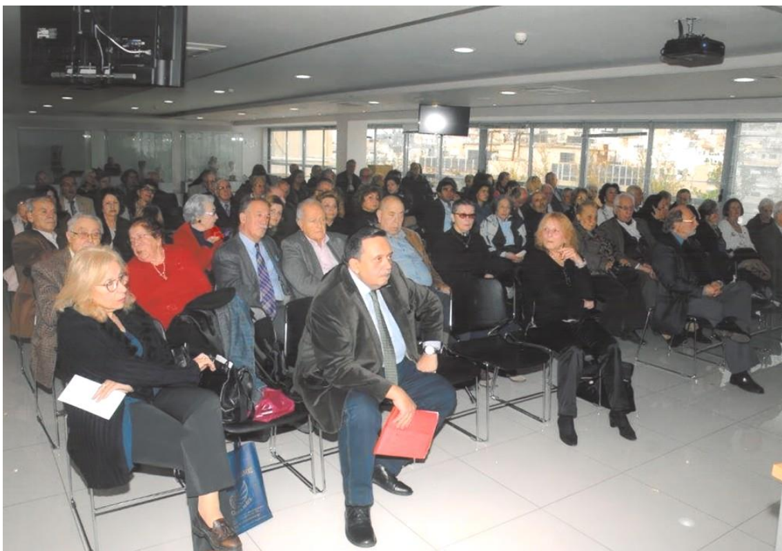
Άποψη της αίθουσας κατά την Ημερίδα.

Κατά την Ημερίδα δόθηκε η ευκαιρία να παρουσιαστεί η συμβολή του ελληνικού πνεύματος στην πνευματική ανάπτυξη του ρωσικού λαού και οι εξελίξεις στις ελληνορωσικές σχέσεις από την εποχή του Βυζαντίου μέχρι σήμερα.